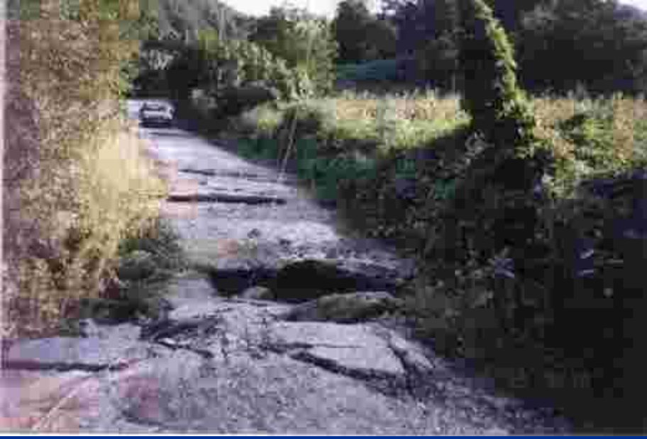
Yol Üzerinde Sağ Yanal Yer Değişirme (Yaklaşık 100 cm)