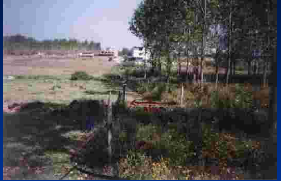
Sağ Yanal Yer Değişirme (Doğu-Batı Yönünde 260 cm)