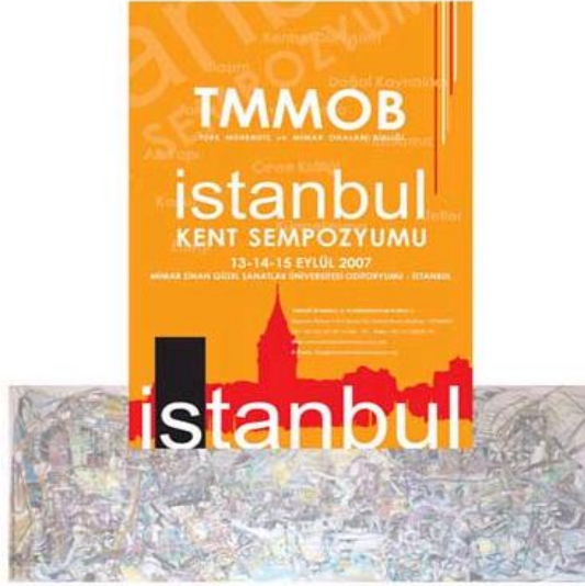
TMMOB İSTANBUL KENT SEMPOZYUMU 13-14-15 EYLÜL 2007